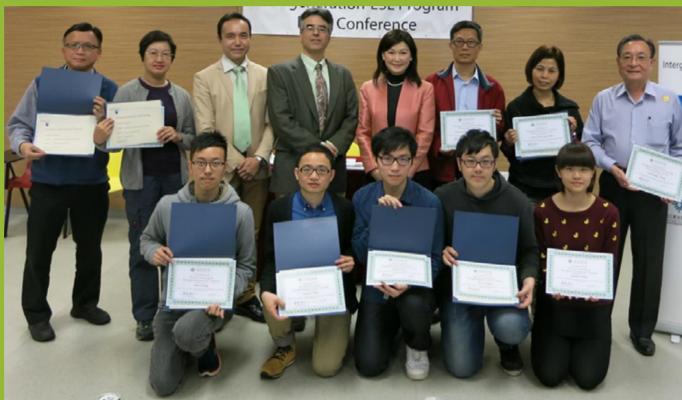
图1：参与者的贡献可以通过新闻发布会得到认可。