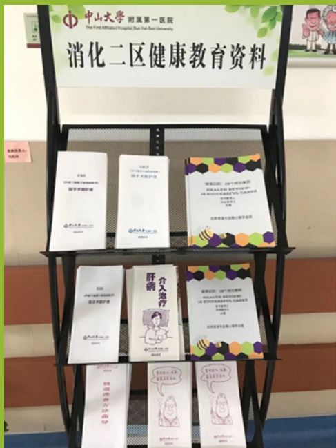
图3: 该小册子在中国一家医院被作为健康教育资料。

除了研究之外,我们还学到了另一个尚未提到的富有成效的成果。这本名为《健康回顾:18 个成功案例》的小册子 (Lai & Xing, 2020) 由两名医生审查后,在学院出版,并最终在中国的一间医院分发,作为医务人员、患者和家属的健康教育资料 (见下图)。它记录了通过代际访谈方法收集的 18 名长者的健康史。